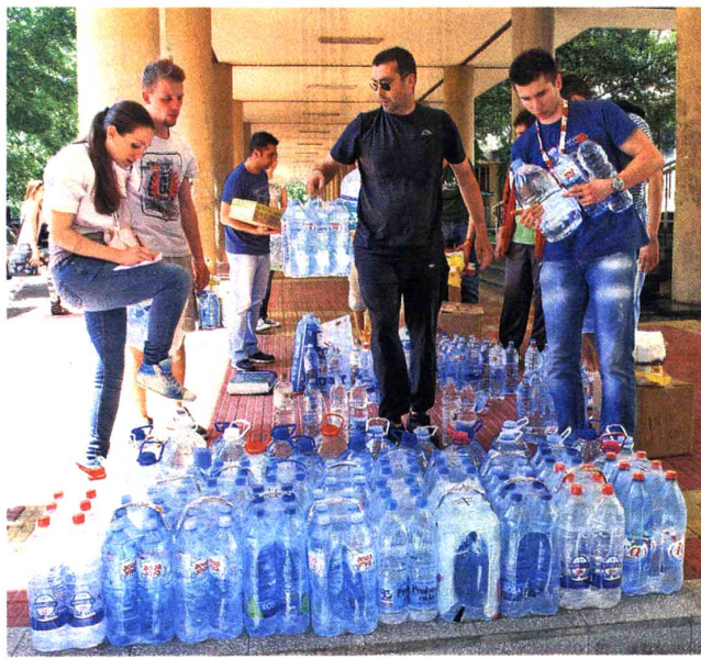
Становништву угроженом поплавама потребно је све