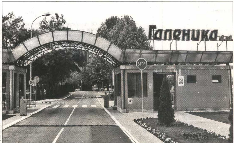
Galenika je uputila i lekove i preparate u vrednosti od 4,5 miliona dinara

Galenika je spremila i tri kombinovana paketa za tri porodice radnika te kompanije koja su raseljena, i ta pomoć će im biti danas uručena.